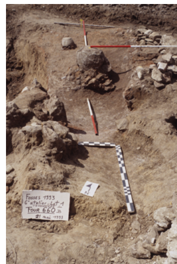
Four en cours de fouille à Fosses.