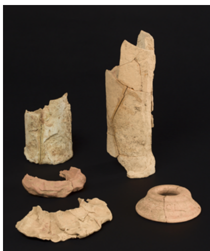
Éléments de construction de fours à sigillée 4 e - 5 e siècles, Écouen, Les Réserves de Chauffour, J.P.G.F. Villiers-le-Bel.

Sont notamment présentés dans cette partie : des illustrations des différents types de fours ainsi qu'une grande photo au sol des vestiges d'un four antique de sigillée en taille réelle tel que retrouvé par les archéologues. Des fragments de fours et des poteries ratées au cours de cuissons sont exposés. Des vidéos en animation 3D réalisées par ARCHÉA spécialement pour l'occasion présentent le fonctionnement de ces fours. Un interactif explique la méthode de datation par l'archéomagnétisme.