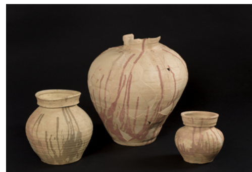
Pots avec décor de flammes