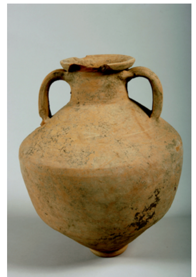
Amphore antique parisienne retrouvée sur le site de la Patte d'Oie à Gonesse, cl. L.Cargouët Inrap.