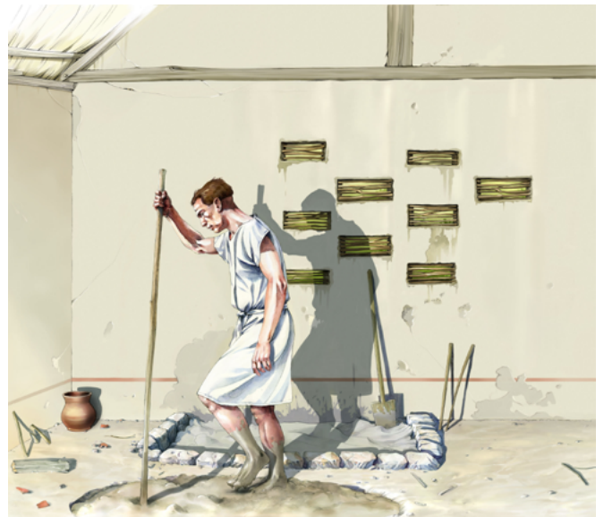
Extrait de l'illustration, étape du marchage de l'argile

Cette première partie donne ainsi à voir au visiteur une cartographie des ressources utilisables dans ce territoire du Pays de France qui s'étend du nord de Paris jusqu'à Senlis et de Pontoise à Meaux, entre la Seine, l'Oise et la Marne. L'extraction, la préparation puis le stockage de l'argile à proximité de l'atelier du potier sont également évoqués en croisant les données archéologiques d'un atelier médiéval mis au jour à Fosses et l'iconographie médiévale.