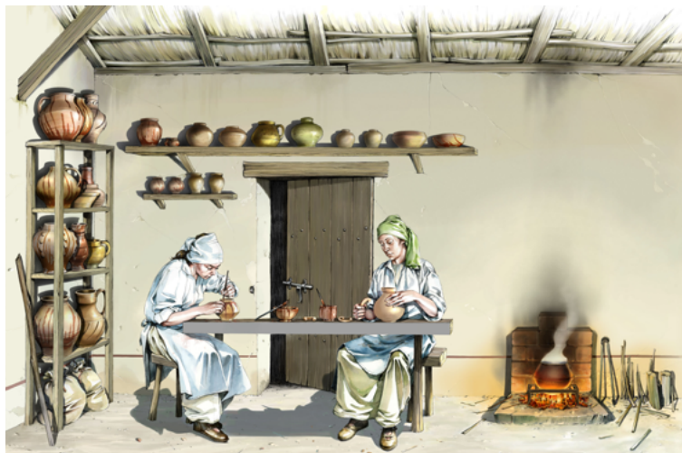
Extrait de l'illustration d'un atelier de potier Étape de décoration

Le travail dans l'intérieur d'un atelier est abordé dans le deuxième thème, « Au tour du potier ». Les traces archéologiques des installations de tournage sont rares et fragiles. D'où l'importance, pour la recherche, l'opérations d'envergure comme celles réalisées dans la vallée de l'Ysieux qui révèlent des vestiges représentatifs : fosses circulaires pour accueillir la roue du tour, nombreux fragments de fils en cuivre pour détacher les fonds, cercles de fer pour renforcer (fretter) l'axe du tour, crapaudine en pierre (godet) qui, placée entre la girelle du tour et le pivot, permet d'initier puis maintenir la rotation par la force d'inertie.