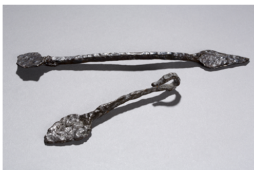
Spatules de potier, Beaumont-sur-Oise.

Sont notamment présentés dans cette partie : les différents types de façonnage et les différents tours de potiers, des céramiques de toute période en fonction de leur décors et les outils nécessaires pour les réaliser, des films présentant la technique antique de la sigillée ou encore de la glaçure médiévale, un jeu de tableau lumineux présentant les noms des différentes parties d'un pot.