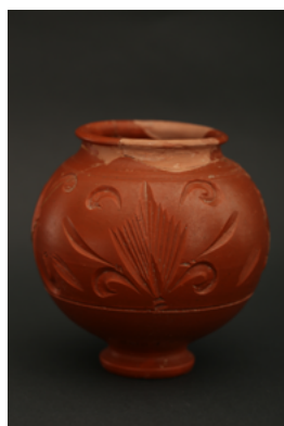
Sigillée décor excisé de Lezoux, cl. A. Maillot, Cd63.