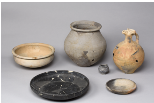
Ensemble de poteries antiques de Beaumont-sur-Oise.

Sont notamment présentés dans cette partie : un meuble des différentes argiles à toucher et les productions liées, une maquette reconstituant un atelier de potier retrouvé par les archéologues à La Boissière-École (Yvelines), une illustration évoquant le vicus (agglomération secondaire) gallo-romain de Beaumont-sur-Oise et des céramiques présentant la diversité des productions.