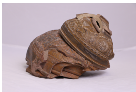
Mouton de sigillée (raté de cuisson) Antiquité gallo-romaine Les Martres-de-Veyre Musée Bargoin, Clermont-Ferrand