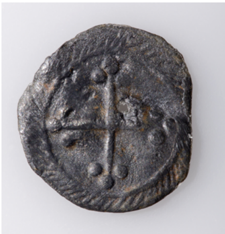
Méreau médiéval, retrouvé sur le site de Fosses.

Sont notamment présentés dans cette partie : des cartes de provenance des céramiques retrouvées sur un seul site archéologique antique (la nécropole antique de Louvres) ou à l'inverse, la zone de diffusion en Île-de-France des céramiques produites dans la vallée de l'Ysieux. Une illustration et des objets évoquent une boutique d'amphores antiques. Des objets comme des méreaux ou jetons témoignent des droits de passage payés pour le commerce des poteries dans les foires et les marchés dans les grandes villes et aux abords de Paris. Des vitrines évoquent la fin de la production de la vallée de l'Ysieux victimes de la concurrence notamment des grès du Beauvaisis. Un jeu de l'oie permet de comprendre les embûches qui se dressent sur le chemin du potier vers son marché.