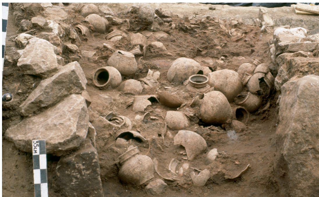
Four et tessonnrière en cours de fouille à Fosses, cl. JPGF.

Une programmation spécifique, avec notamment des ateliers pour scolaires et individuels, sera proposée sur place à cette occasion.