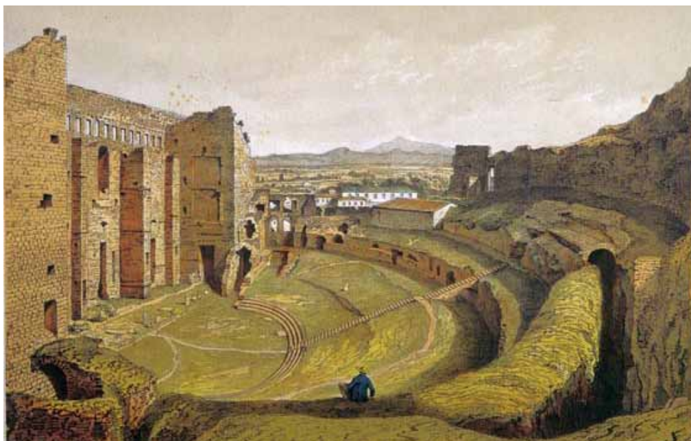
Ruines du Théâtre romain à Orange au XVII ème siècle.