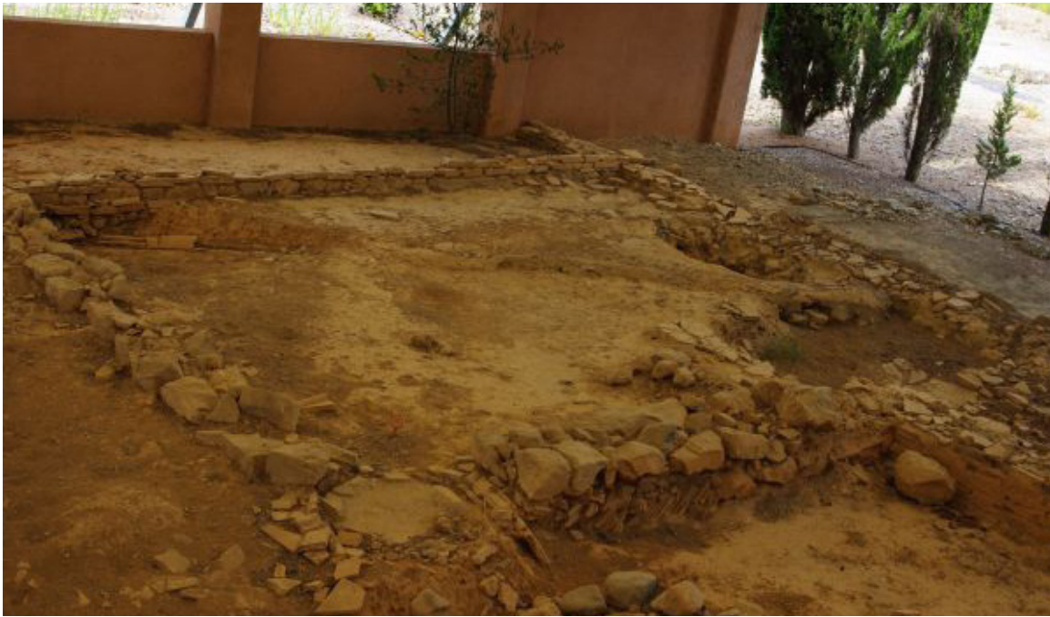
Pièce d'un habitat sur le site archéologique