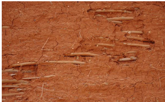
Mur à restaurer : les branches apparaissent sous la terre