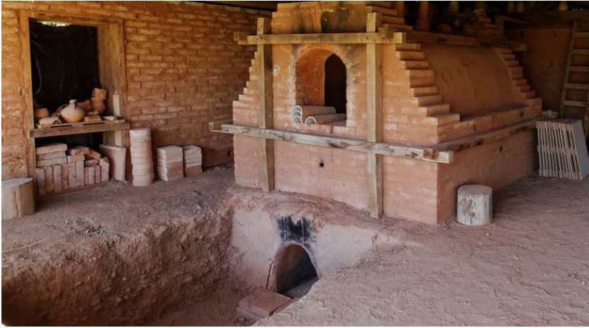
Reconstitution du four 4