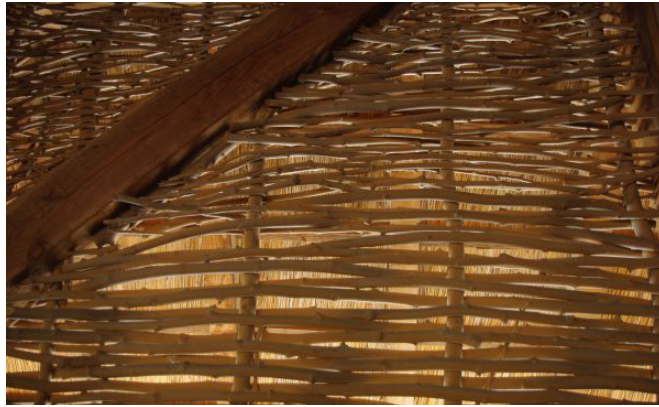
Tressage des branches