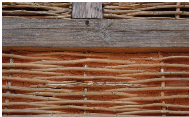
Remplissage d'un mélange de terre et de paille en plusieurs couches