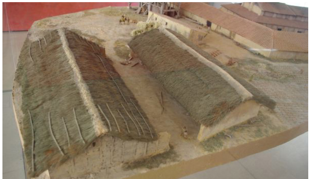
Maquette des habitats