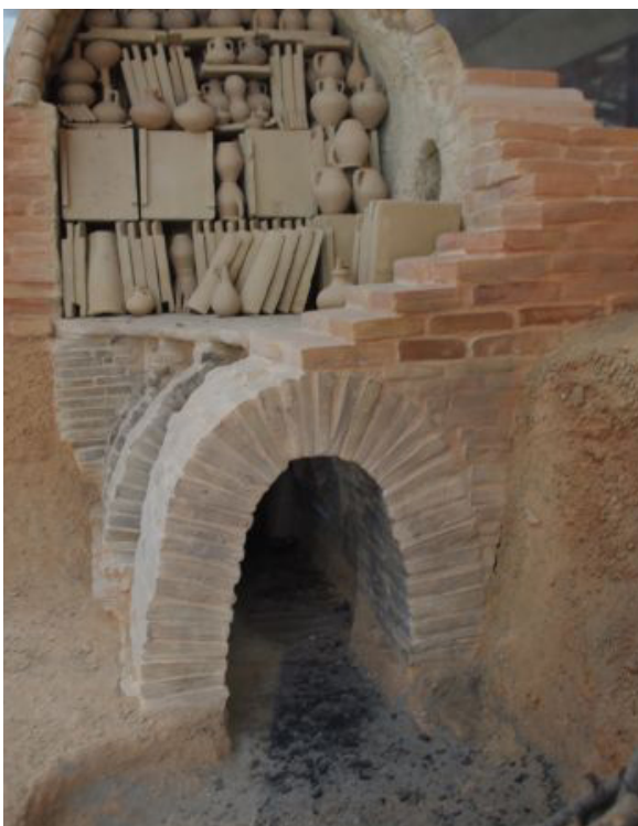
Maquette du four 4