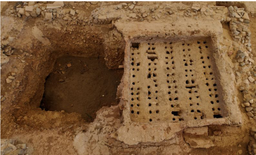
Sole du four 4 sur le site archéologique