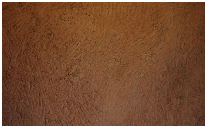
Dernière couche posée