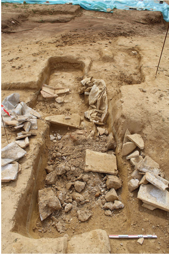
Fouille saccagée