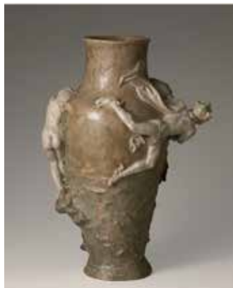
Marcel DEBUT, Vase de la Manufacture de Sèvres : Persée délivrant Andromède , grès, fin du 19 e siècle, Lille, Palais des Beaux-Arts