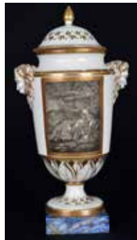
Manufacture LEPERRE-DUROT (Lille), Paire de vases d'ornement : La Naissance d'Adonis et Diane surprise par Actéon , porcelaine dure aux couleurs de petit feu avec rehauts d'or, fin du 18 e siècle, Douai, Musée de la Chartreuse