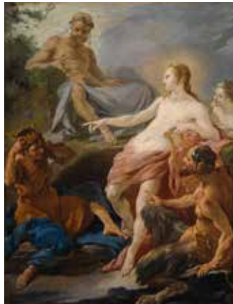
Noël HALLE, Apollon et Midas , huile sur papier marouffé sur toile, vers 1750, Lille, Palais des Beaux-Arts