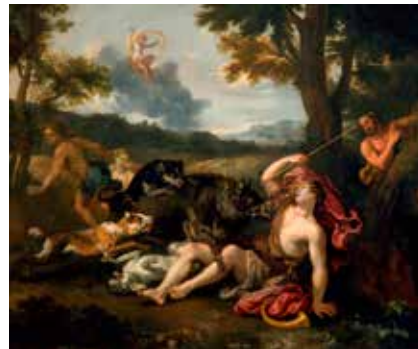
École française, La Mort d'Adonis , huile sur toile, 2 e moitié du 17 e siècle, Dunkerque, Musée des Beaux-Arts