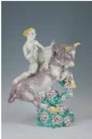
Jean-René GAUGUIN, L'Enlèvement d'Europe , faïence émaillée, 1925, Roubaix, La Piscine – Musée d'art et d'industrie André Diligent © Musée La Piscine (Roubaix), Dist. RMN-GP / Alain Leprince