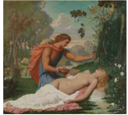
Léopold BURTHER, Aréthuse et Alphée , huile sur toile, Salon de 1847, Roubaix, La Piscine – Musée d'art et d'industrie André Diligent