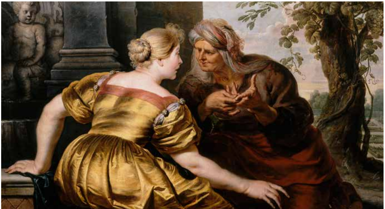
Cornelis DE VOS, Vertumne et Pomone (détail), vers 1631-1635