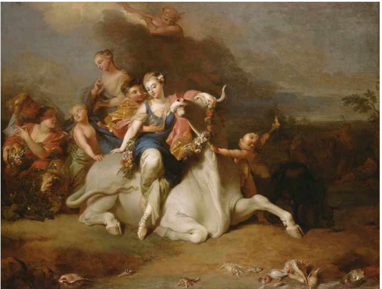
Sébastien II LECLERC, Enlèvement d'Europe , avant 1714

Il évoque aussi l'histoire très fameuse d'Icare et de Dédale ou les efforts vains d'Orphée pour ramener des Enfers son épouse Eurydice. Autant de figures de la mythologie gréco-latine qui ont été des sources inépuisables d'inspiration pour les artistes tout au long des siècles et encore de nos jours.