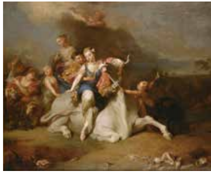
Sébastien II LECLERC, Enlèvement d'Europe , huile sur toile, avant 1714, Dunkerque, Musée des Beaux-Arts