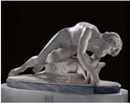
Ernest HIOLLE, Narcisse , marbre, 1868, Valenciennes, Musée des Beaux-Arts