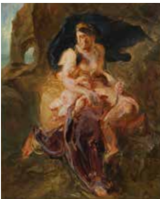
Eugène DELACROIX, Médée s'apprêtant à assassiner ses enfants , huile sur toile, 1838, Lille, Palais des Beaux-Arts