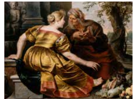
Cornelis DE VOS (paysage de Jan WILDEN), Vertumne et Pomone, huile sur toile, vers 1631-1635, Hazebrouck, Musée des Augustins