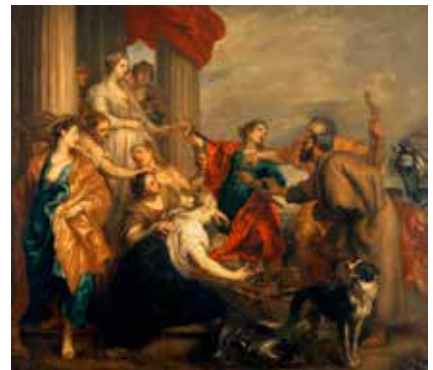
Atelier d'Anton VAN DYCK, Achille parmi les filles de Lycomède , huile sur toile, vers 1630, Dunkerque, Musée des Beaux-Arts