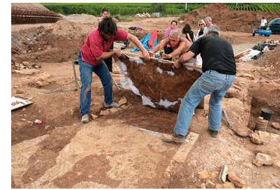
4 : .....