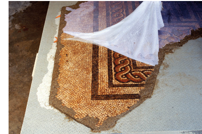
9 : .....