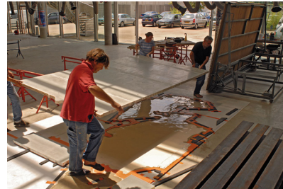
8 : .....