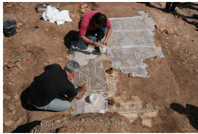
2 : .....