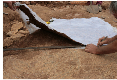
3 : .....