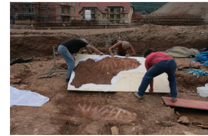
5 : .....