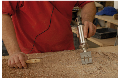
7 : .....