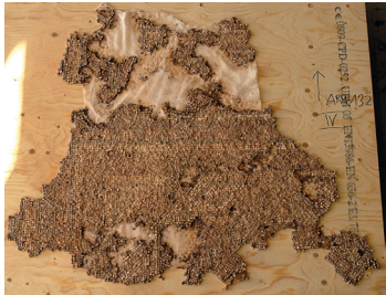
6 : .....