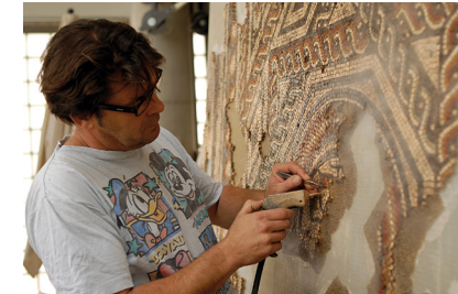
10 : .....

Les 10 étapes de la restauration d'une mosaïque (dans le désordre) :