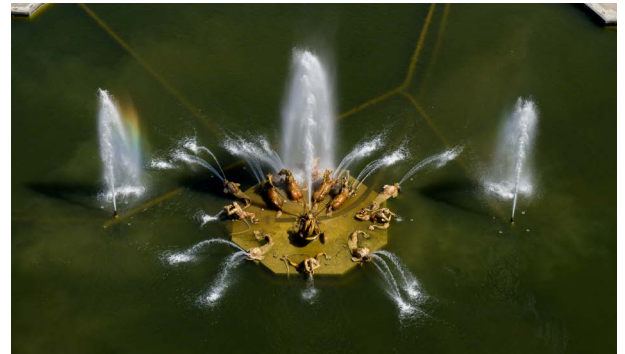
Bassin du char d'Apollon vue du ciel

L'ensemble d'Apollon sur son char comprend treize statues.