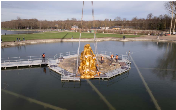
Repose du groupe sculpté du char d'Apollon

Le groupe sculpté du char d'Apollon a été réinstallé au cœur des jardins de Versailles. Comme lors de sa précédente extraction, le processus de réinstallation a exigé trois jours pour remettre en place les treize sculptures en plomb à l'aide d'une grue télescopique.