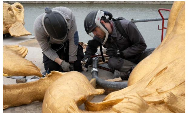
Raccordement du groupe sculpté du char d'Apollon

avec fidélité la diversité des effets d'eau du XVIIe siècle, tels qu'ils étaient documentés dans les dessins, les peintures ou les gravures d'archive. Les ajustages ont été rétablis selon les dispositions d'origine, permettant aux fontainiers de retrouver la forme et le volume des jets tels qu'ils étaient durant le règne