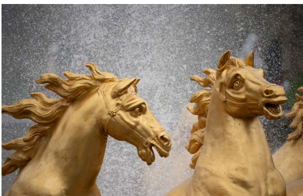
Deux des quatre chevaux du char d'Apollon

Les quatre chevaux du char 1 , répartis deux par deux de part et d'autre du conducteur, sont représentés en mouvement, hennissant et bondissant, chacun adoptant une attitude singulière qui contribue à donner dynamisme et variété à l'ensemble.