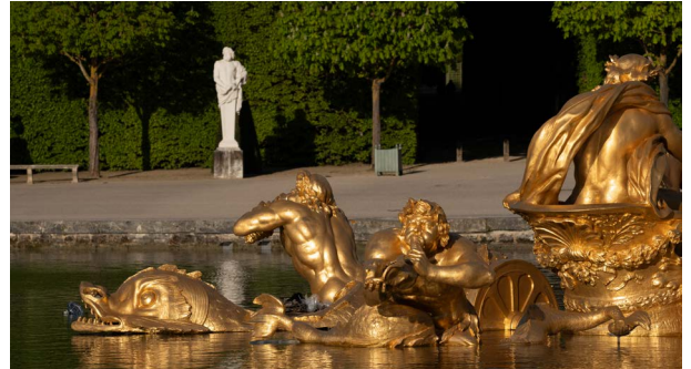
Les tritons et les dauphins du bassin

Enfin, dans les intervalles des diagonales, quatre dauphins, animaux totémiques d'Apollon, sortent la tête de l'eau et complètent le cortège.