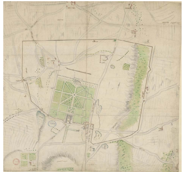
Plan_manuscrit_du_domaine @ gallica.bnf.fr / Bibliothèque nationale de France

Dans le parc, un grand rond-point rayonnant et trois grandes allées sont tracés, une vers le Château (c'est l'Allée Royale, également nommée Tapis Vert en raison de la bande de gazon qui se déroule en son milieu), une vers Trianon et une vers la Ménagerie. Le réservoir du Rondeau est agrandi et devient un bassin de forme rectangulaire quadrilobée de 60 toises (117 m) sur 40 (78 m). Il est nommé Bassin des Cygnes en raison de la présence des cygnes que Louis XIV y a fait placer.