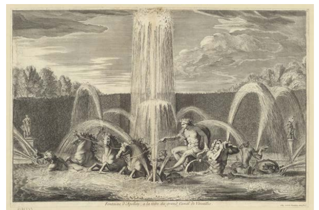
Fontaine d'Apollon, à la teste du grand Canal de Versailles

Vers 1665, l'Allée Royale est élargie et le Grand Canal est creusé entre 1667 et 1679. Le Bassin des Cygnes prend alors l'appellation de Bassin d'Apollon qu'il porte encore aujourd'hui.