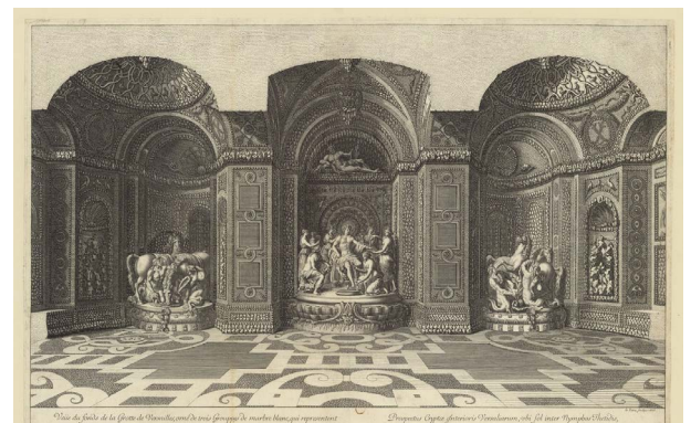
Description de la grotte de Thétys, Jean Lepautre, 1676

Apollon servi par les nymphes , groupe de sept statues en marbre réalisé en 1666 par François Girardon et Thomas Regnaudin et placé à l'origine à l'intérieur de la grotte de Thétys, constitue le pendant crépusculaire de ce groupe.