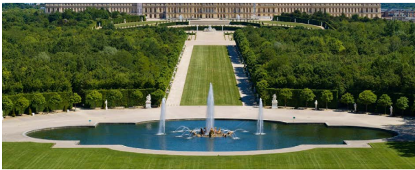
Bassin du char d'Apollon

Chaque sujet sculpté a une posture unique et jaillit dans l'ensemble de façon dynamique. La composition symétrique des effets d'eau contribue à la majesté de la fontaine et forme un écrin qui encadre le groupe, destiné à être vu depuis le bas de l'Allée Royale. Situé sur la Grande Perspective, le Bassin du Char d'Apollon est un brillant mariage entre sculptures de plomb et gerbes d'eau, un hommage délicat de l'eau à la lumière.