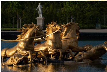
Bassin du char d'Apollon, la quadriga

Alors même que le groupe sculpté était en cours d'exécution aux Gobelins, Jean de La Fontaine