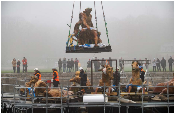
Dépose des groupes

Les treize sculptures en plomb ont été déposées à la Fonderie de Coubertin, à Saint-Rémy-lès-Chevreuse, pour commencer leur restauration. Ce processus a impliqué l'utilisation d'une grue télescopique pour soulever chaque statue préalablement sanglée sur un support métallique à l'aide d'élingues et de palonniers. Cette opération de grutage a nécessité trois jours pour être réalisée dans son ensemble.