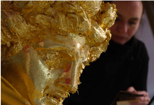
Pose de feuilles d'or