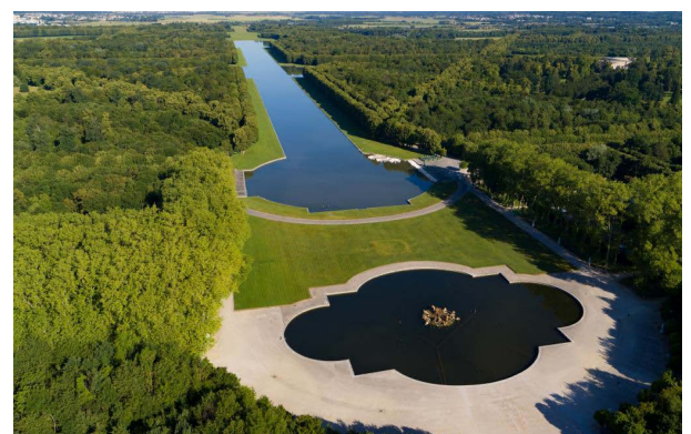
Bassin du char d'Apollon, dans la perspective du Grand Canal

Création inédite en France, ce groupe sculpté gigantesque vient ainsi orner le plus ancien bassin du domaine de Versailles et permettre à ce dernier, placé au centre de la Grande Perspective, d'accentuer l'effet de profondeur du Grand Canal et de magnifier le château et la présence du roi à Versailles.