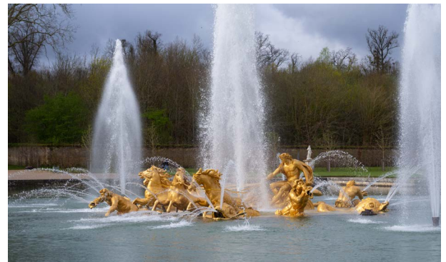
Jets du bassin du char d'Apollon

Le réseau hydraulique du bassin d'Apollon est alimenté par trois sources distinctes : le bassin de Latone (pour le jet central de la fontaine), les bassins des Lézards (pour les jets latéraux), les bassins des Jambettes (pour les effets d'eau des tritons, des chevaux et des dauphins). Trois gerbes - dont la plus haute peut atteindre 19 mètres de haut - s'élèvent en panache pour former une fleur de lys. Cet effet d'eau a été remplacé en 2005 et nous avons actuellement un « Grand Jet » droit.