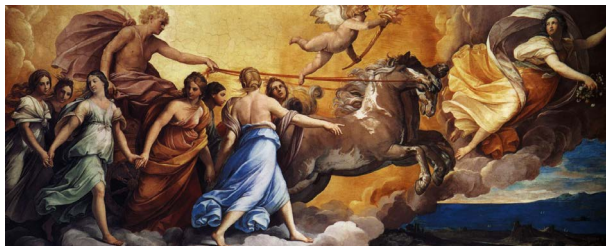
Aurore et Apollon, Guido Reni, 1614 © Palazzo Pallavicini Rospigliosi

Tuby, natif de Rome, s'inspire ainsi de la fresque du casino dell'Aurora peinte par Guido Reni au Palazzo Rospigliosi-Pallavicini. On y voit, à droite, une jeune femme à la tunique dorée, l'Aurore, qui vole en répandant des fleurs sur la terre encore obscure. Elle ouvre la voie à un putto qui tient une torche, c'est Phosphore, la première étoile du matin, et précède le char du Soleil conduit par Apollon qui est entouré par des jeunes femmes qui se tiennent la main, ce sont les Heures.