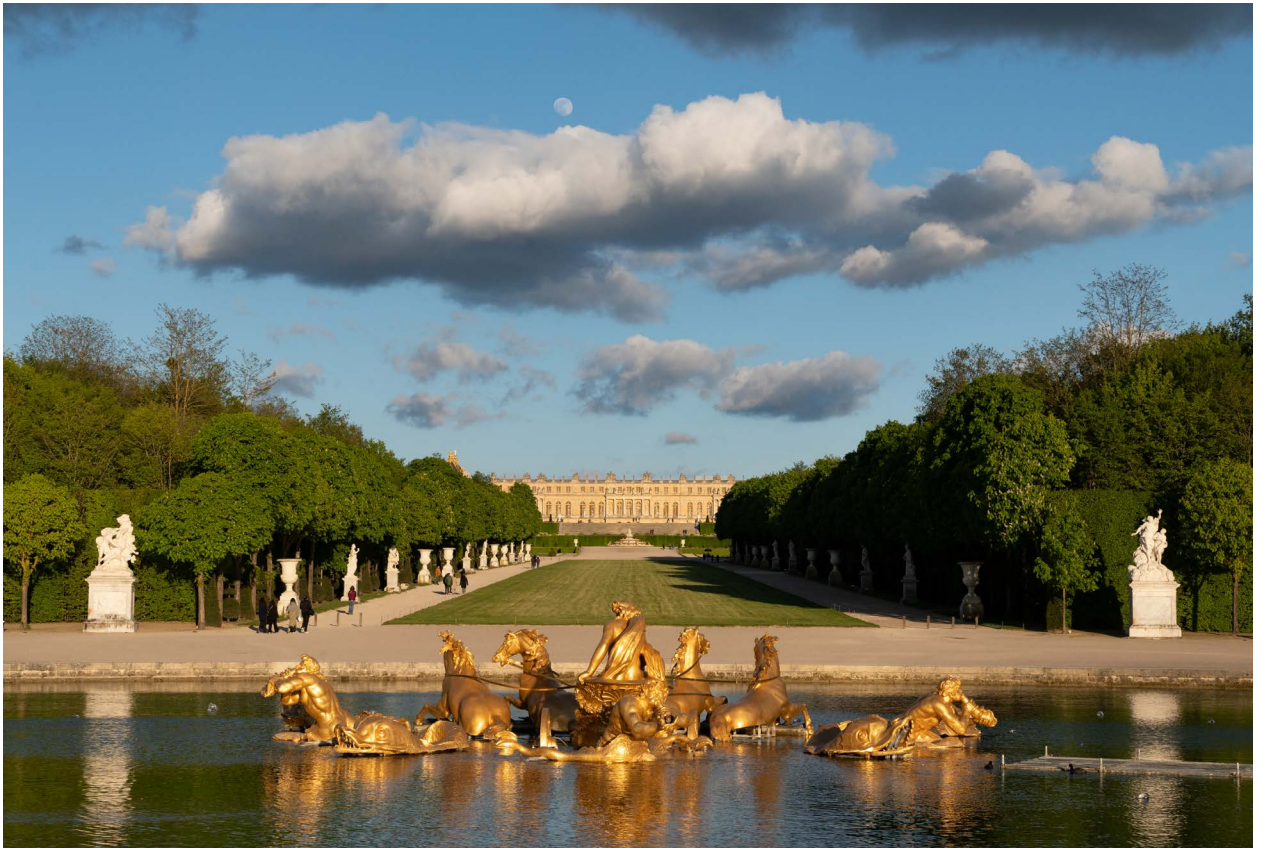
Le bassin du char d'Apollon