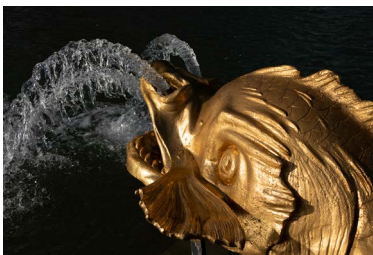
Bassin du char d'Apollon, un dauphin

L'arrivée de ce chef-d'œuvre monumental emblématique constitua un événement majeur dans l'histoire de Versailles. Le Bassin d'Apollon rencontra l'admiration de tous.