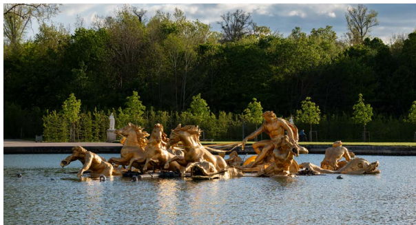
Bassin du char d'Apollon

Parmis le groupe, un putto est allongé, tenant dans ses mains la gerbe d'eau principale.