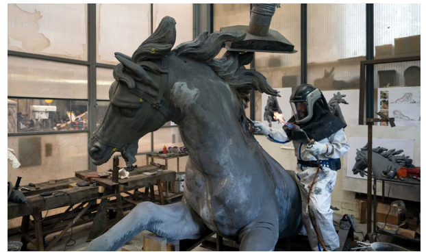
Travail de la Fonderie Coubertin sur les chevaux du bassin

et identifier les réparations précédentes. Ensuite, ils ont renforcé les armatures internes pour consolider la structure, améliorer la répartition des charges et prévenir les risques d'affaissement. Des travaux spécifiques ont été réalisés sur les parties déformées, telles que les têtes, les pattes et les bustes, notamment en redressant les encolures des chevaux présentant des affaissements importants. Enfin, les restaurateurs ont réparé les surfaces externes en utilisant un alliage de plomb-étain compatible avec le plomb ancien, comblant les fissures et remplaçant les brides modernes des chevaux par des répliques fidèles aux originaux.