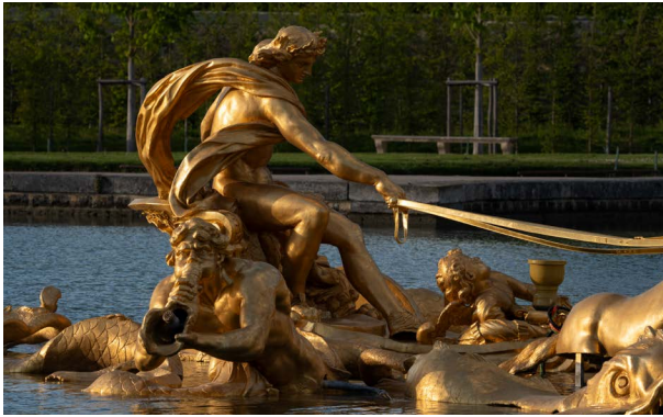
Bassin du char d'Apollon vue du côté. Le putto est en bas à droite.

Parmis le groupe, un putto est allongé, tenant dans ses mains la gerbe d'eau principale.