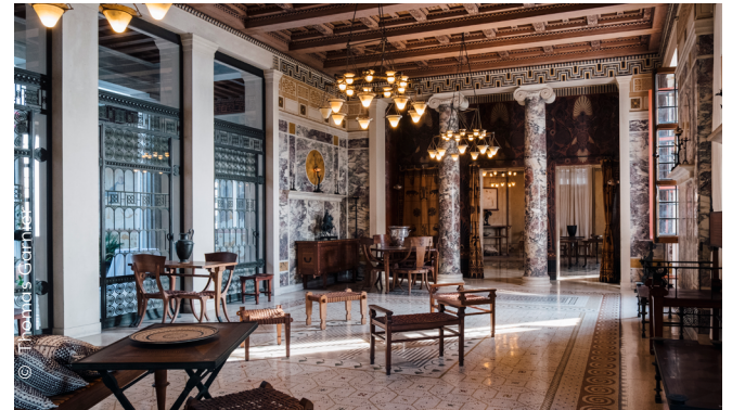
Une villa antique, un confort moderne

Les luminaires furent classés au titre des monuments historiques en 1965, avec l'ensemble du mobilier en même temps que le classement de la villa comme immeuble. Cette protection globale de l'édifice et de son décor et mobilier reconnaît précocement le caractère exceptionnel de la villa comme œuvre d'art totale. Fruit d'une étroite collaboration entre Théodore Reinach et Emmanuel Pontremoli, les luminaires éclairent la villa d'une ambiance chaude et enveloppante. Ils sont composés de lampadaires aux pieds animaux ou géométriques dessinés, de lustres d'albâtre ou composés de godets d'opaline sur une structure de bronze, de lampes de chevet aux abat-jours de masque, ou encore d'appliques aux bras dessinés de forme végétale. La mise aux normes de l'électricité de l'ensemble de la villa est l'occasion de déposer et de restaurer l'ensemble de ces luminaires qui a souffert depuis leur installation en 1906. Le ministère de la culture, via l'accompagnement de la DRAC PACA accompagne ce projet de restauration ambitieux par une subvention et un contrôle scientifique et technique.