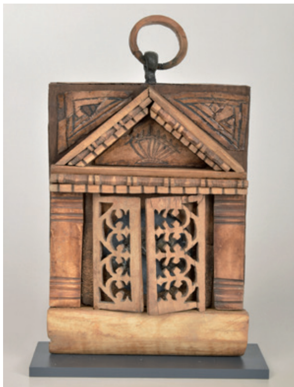
☉ Miroir. Bois, os, ivoire, métal, parking du Pré des Pêcheurs, Antibes (fouilles Inrap, 2012), IV e - VI e siècles après J.C. Musée d'Archéologie, Antibes.

La face avant, en os, représente la façade d'un temple avec base, fronton et deux colonnes entre lesquelles ouvrent deux portes ajourées qui cachent un miroir circulaire en métal blanc (étain ou argent). Au dos, une marqueterie de bois représente une femme dansant sous un édifice à colonnes et arcatures. Cet objet exceptionnel n'a qu'un seul équivalent dans les collections du Corning Museum of Glass (État de New York). Cliché Arc-Nucléart, Grenoble.