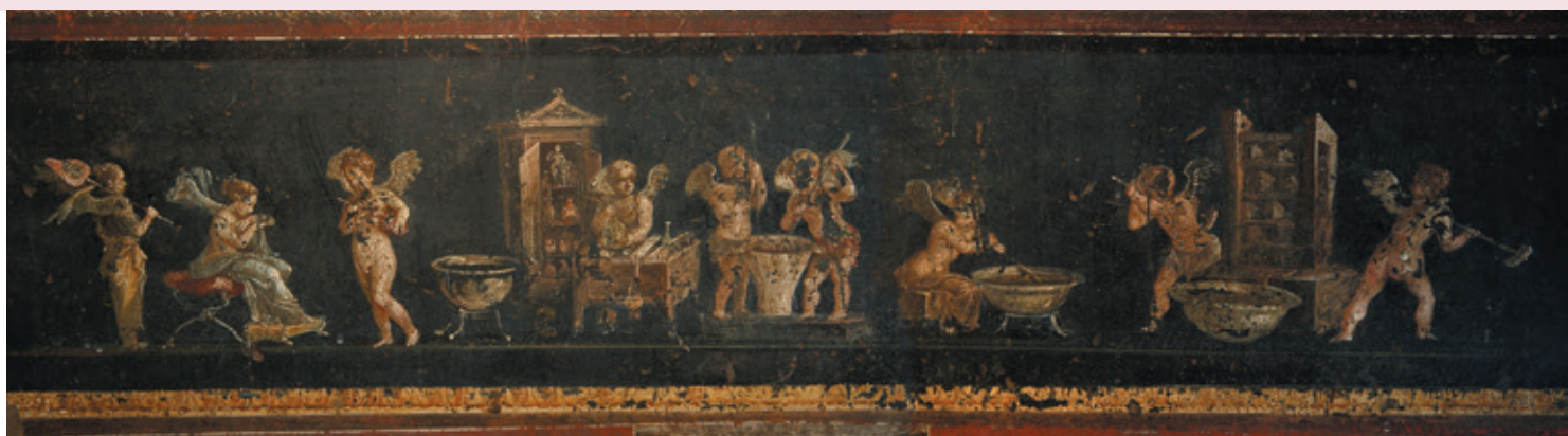
Peinture de la Maison des Vettii à Pompéi représentant la préparation et la vente des parfums.