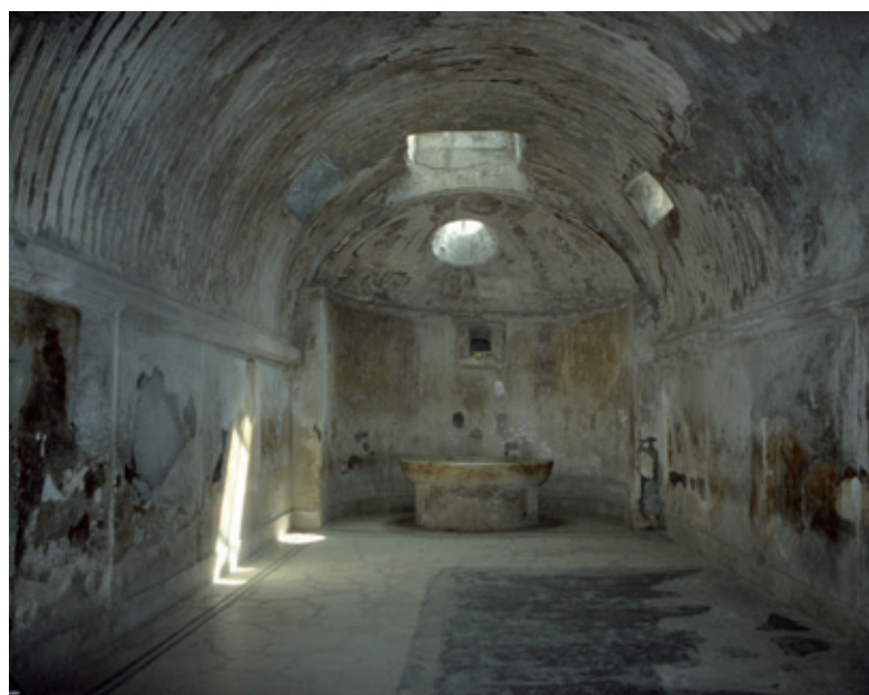
📍 Pompéi, les thermes du forum, pièce chaude équipée d'une vasque.

Les bains publics romains comprennent une enfilade de pièces progressivement chaudes, certaines pourvues de piscines. La chaleur peut être humide ou sèche. Les usagers passent d'une salle à l'autre, transpirent et se refroidissent en se plongeant dans des bains froids. Les corps sont enduits d'huile et la peau raclée avec un strigile, une lame en fer recourbée pourvue d'un manche.