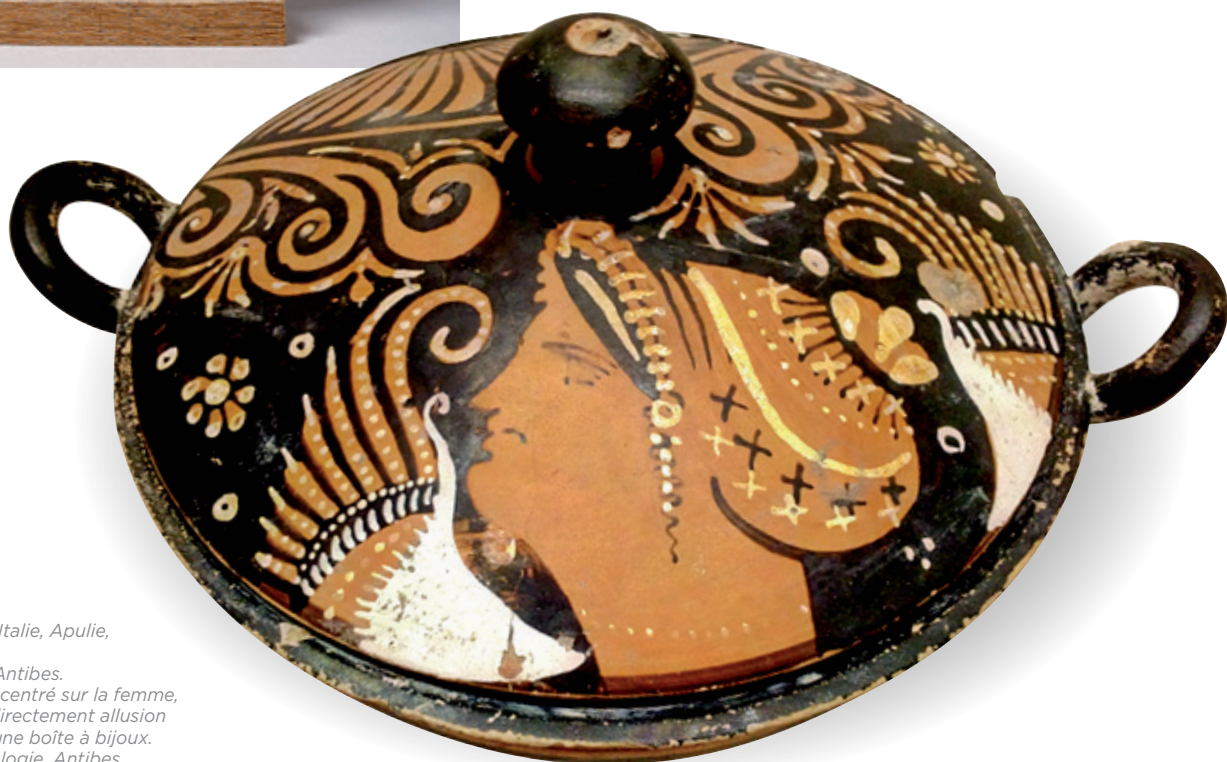
☉ Lekanis, terre cuite, Italie, Apulie, IV e siècle avant J.-C. Musée d'Archéologie, Antibes. Le décor du couvercle centré sur la femme, richement parée, fait directement allusion à la fonction du vase, une boîte à bijoux.