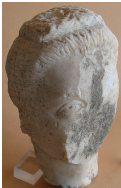
☉ Tête de femme, marbre, III e siècle après J.-C., fouilles de Cimiez. Musée d'Archéologie de Nice-Site de Cimiez.

La chevelure, qui forme un chignon, est entièrement enveloppée dans une étoffe enroulée autour de la tête et serrée par une bandelette au sommet de la tête. Au-dessus du front, les cheveux sont disposés en rondin. Une large mèche de cheveux frisés couvre chacune des oreilles. La coiffure enserrée dans un sakkos est très présente dans l'iconographie de l'époque grecque classique.