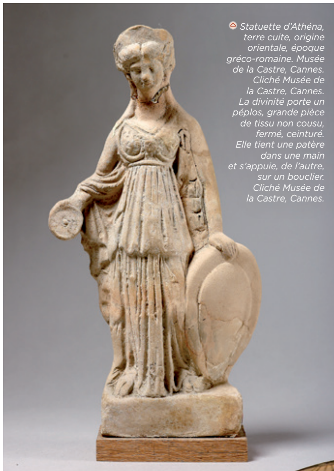
☉ Statuette d'Athéna, terre cuite, origine orientale, époque gréco-romaine. Musée de la Castre, Cannes. Cliché Musée de la Castre, Cannes. La divinité porte un péplos, grande pièce de tissu non cousu, fermé, ceinturé. Elle tient une patère dans une main et s'appuie, de l'autre, sur un bouclier. Cliché Musée de la Castre, Cannes.