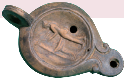
☉ Lampe à huile avec une femme à sa toilette devant une fontaine, terre cuite, Cimiez. Époque romaine. Musée d'Archéologie de Nice - Site de Cimiez.