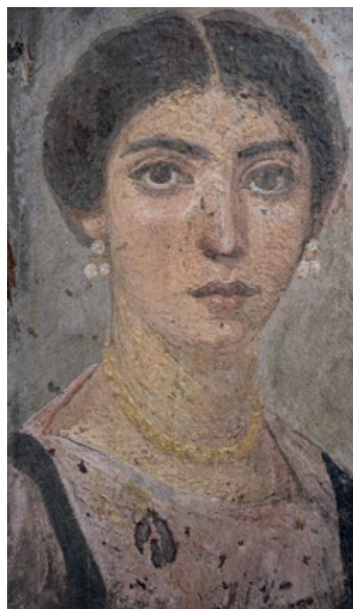
Portrait de femme, Égypte, vers 120-150 après J.-C. Cliché Carole Raddato, Francfort. D.R.