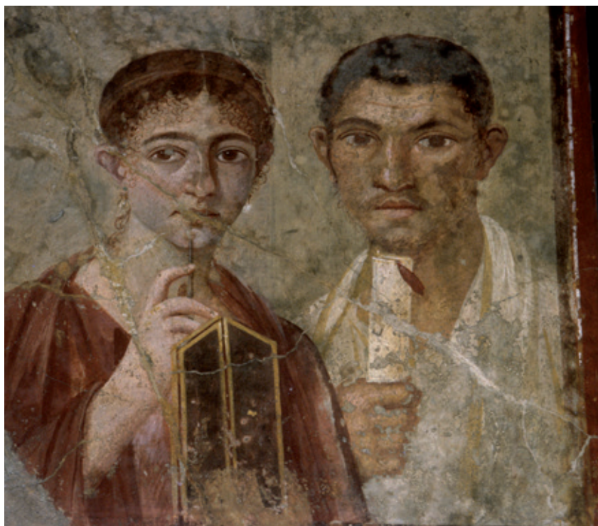
📍 Portrait dit de Paquius Proculus, Pompéi, vers 20-30 après J.-C. Musée Archéologique de Naples.