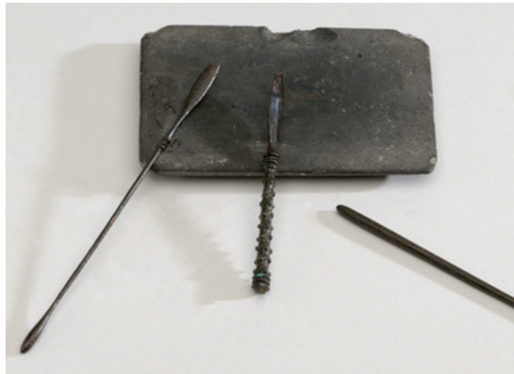
Spatules, sonde et tablette à broyer des poudres et des onguents, alliage cuivreux et ardoise, époque gallo-romaine. Musée d'Archéologie, Antibes. Ces trois instruments en bronze et la tablette en pierre qui les accompagne, pouvaient également avoir un usage médical, particulièrement en ophtalmologie. Cliché Sept Off, Nice.

Le maquillage fait partie de l'attirail de toute bonne séductrice. L'origine en revient aux Grecs. Le but est de renforcer les contrastes chromatiques du visage. On utilise pour cela trois couleurs dominantes : le blanc, le rouge et le noir. Pour accentuer la pâleur du teint, on a recours à la craie, la cerussa (blanc de plomb) qui permet également de lisser le teint et de l'unifier. Le rouge sert à renforcer la couleur des joues et des lèvres et le contour des yeux est souligné de noir qui servait aussi à colorer les paupières et à mettre en valeur cils et sourcils. Un maquillage bien dosé est un artifice dont on se sert pour rehausser ou parfaire sa beauté. Mal utilisé, il est connoté péjorativement : « Tu résides, ô Galla, dans une centaine de pyxides (boîtes), et la figure que tu montres ne dort pas avec toi. » (Martial, Épigrammes , IX, XXXVIII). La recherche du bronzage, si prisée de nos jours, était perçue à Rome, au moins pour les femmes, comme la marque d'une vie rustique et était, à ce titre, proscrit par les citadines élégantes !