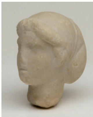
☉ Tête féminine, Marbre, époque romaine, Antibes, quartier des Blancheries. Musée d'Archéologie, Antibes.

Malgré les modes, cependant, la femme, pour être belle, doit veiller à se coiffer en choisissant ce qui lui « sied le mieux » et pour ce faire, doit avant tout « consulter son miroir », rappelle Ovide.