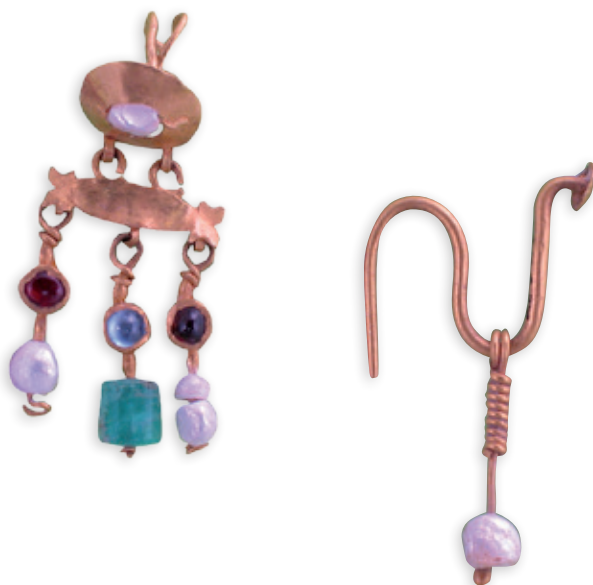
☉ Boucle d'oreille, or et perle, Nice-Cimiez, thermes de l'Est, Haut-Empire romain. Musée d'Archéologie de Nice-Site de Cimiez.