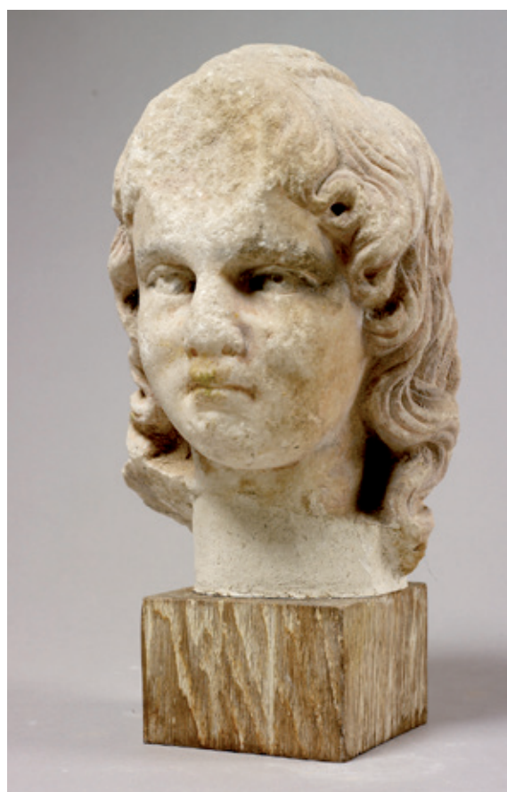
☉ Visage d'enfant à long cheveux bouclés et tresse médiane, marbre, Syrie, I er siècle avant J.-C. - I er siècle après J.-C., Musée de la Castre, Cannes.