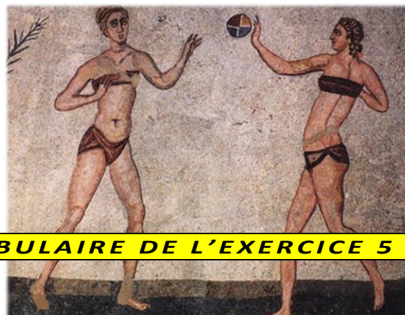
Mosaïque de la villa romaine du Casale (Sicile). ↓

— TOUT LE VOCABULAIRE DE L'EXERCICE 5 EST À RETENIR. —